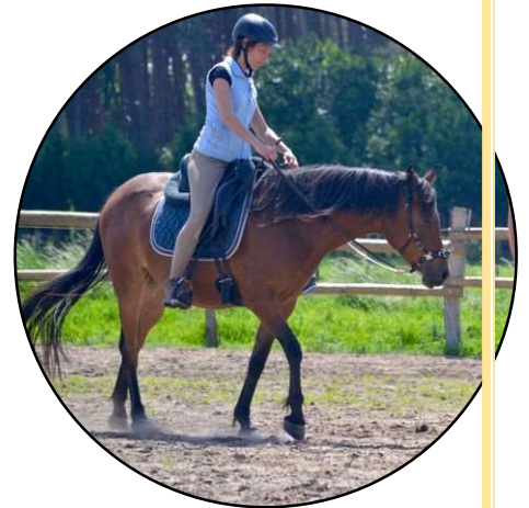
Week/ weekend student