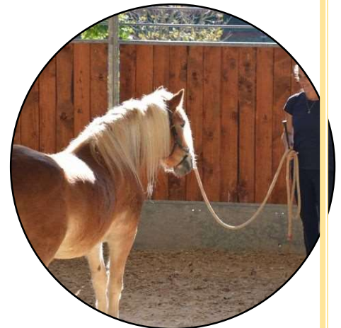
Clinics en theorielessen

Voor meer informatie kan je mijn website bezoeken.