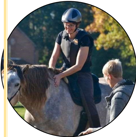
Paard in training