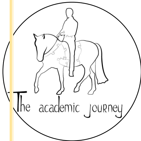
Opleidingstraject uit 5 modules

Om je zo goed mogelijk te kunnen begeleiden, bied ik verschillende opties aan. De verschillende opties variëren in intensiteit en vorm. Even een overzicht: